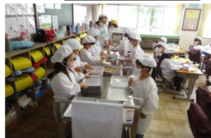
【友達と協力して配膳する1年生】

新学期が始まって2カ月経ちました。新しい学級にも慣れ、子ども一人ひとりが自分の居場所を見つけ、元気に学校生活を送っています。先日、5年生と一緒にさいたま市文化センターで行われた管弦楽鑑賞教室に行ってきました。バスの中でも会場でも子どもたちは落ち着いて行動し、音楽を全身で楽しんでいました。高学年らしい姿に、子どもたちの成長を改めて感じました。