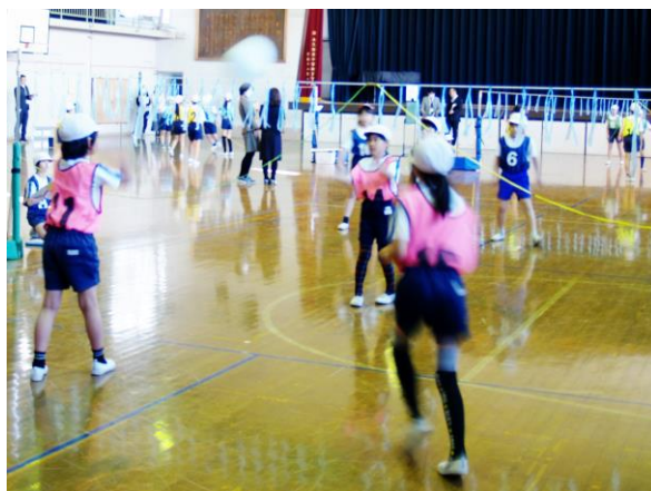
【 1/30 4年生 体育科研究授業 】