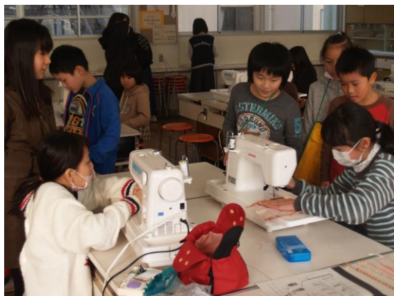
【 1/29 3年生 クラブ見学 】