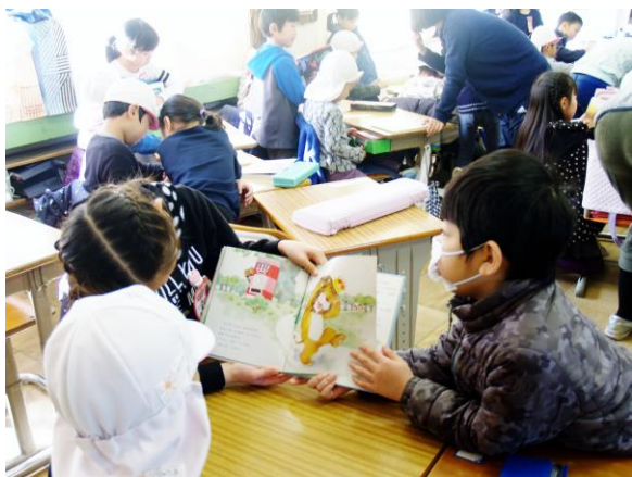
【 1/31 1年生 東小は楽しいよ会 】