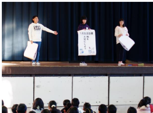
【 1/15 6年生 生活目標朝会 】