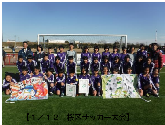
【1/12 桜区サッカー大会】

先月12日にレズランドで行われた桜区サッカー大会に、校内大会で優勝した6年3組男子と6年2組女子が学校代表として出場しました。結果は男子が準優勝、女子は3位と健闘しました。男女ともよく頑張りました。毎日のように取り組んできた、練習の成果を発揮し、一生懸命にプレーする姿が大変印象的な東っ子でした。