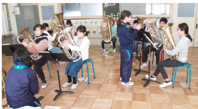
【 1/27 金管バンド小・中合同練習 】