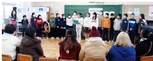
【海外日本語教師研修「はじめの会」】

1月17日の海外日本語教師研修で、様々な国で日本語指導をされている13名の外国人教師の先生方と2名の国際交流基金の職員さんがいらして、本校の子どもたちと交流しました。第一音楽室で国際委員会の子どもたちによる「はじめの会」をして校内を案内した後で、4年生と5年生の各クラスに分かれて「クラス交流会」「給食体験」「清掃体験」を行いました。「クラス交流会」では、外国人教師の皆さんの国の紹介もとても熱心にしていただきました。その後、全校の授業見学をしていただきましたが、日本の学校の授業を興味深くご覧になっていました。子どもたちは、外国人教師との交流を通して、それぞれの国の社会や教育・文化について理解を深めるよい機会になりました。