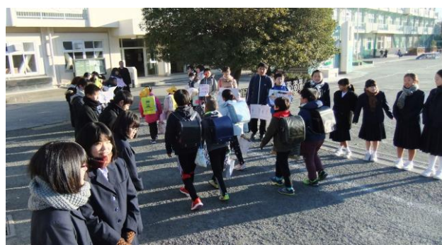
【 1/15 中学生も参加のあいさつ運動 】