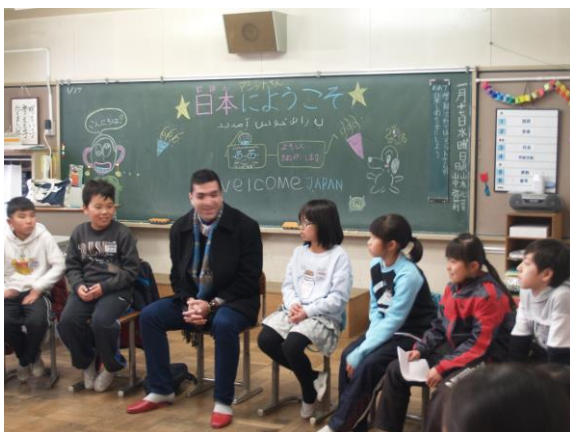
【 1/17 5年生 海外日本語教師研修 】