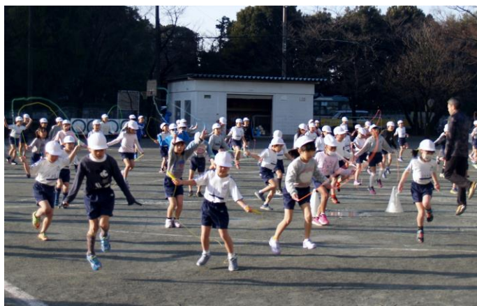
【 1/18 2年生 体育朝会 (なわとび) 】